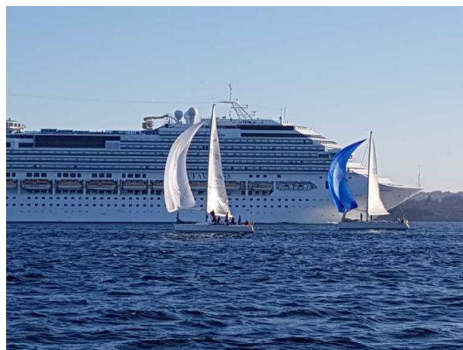
Det kan være kamp om plassen på Hjeltefjorden om tirsdagene

Det var også i år planlagt finale for alle kretsens trimseilere. Denne var planlagt ved sesongslutt, men av forskjellige grunner måtte denne utsettes. Det vil bli finale fro 2016 sesongen ifb, Vårbløyta i april 2017, arrangert av Ran.